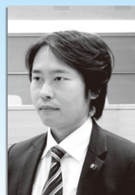
渡辺聡一郎 議員 (新風の会)

新規事業者の誘致については、空き店舗等の調査及びデータ化に努め、埼玉県企業立地課等と連携し、企業の進出要望を収集し遊休不動産の活用に努めたい。